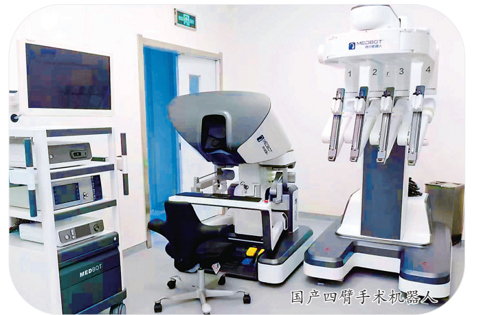
国产四臂手术机器人