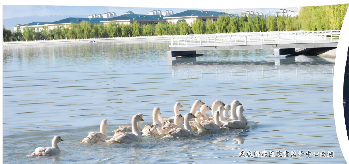
武威肿瘤医院重离子中心南湖

联系方式:王老师 18419558566 毛老师 19993505535 人事科 0935-6988558 邮 箱: 673467750@qq.com