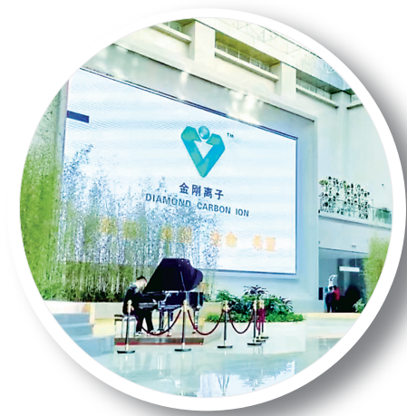
武威肿瘤医院重离子中心接待大厅

甘肃省武威肿瘤医院(甘肃省武威医学科学院)是甘肃省武威市市属公立医院,中国重离子治疗肿瘤系统临床应用医院,是一家现代高科技医院、园林式医院、智慧云医院、人文康养医院、绿色双碳达标医院,是“一带一路”沿线一家令人瞩目的肿瘤重离子综合治疗康养中心。医院由重离子国际医学城院区、中心院区构成,形成“一体两翼”诊疗体系。医院同时还拥有以下特点: