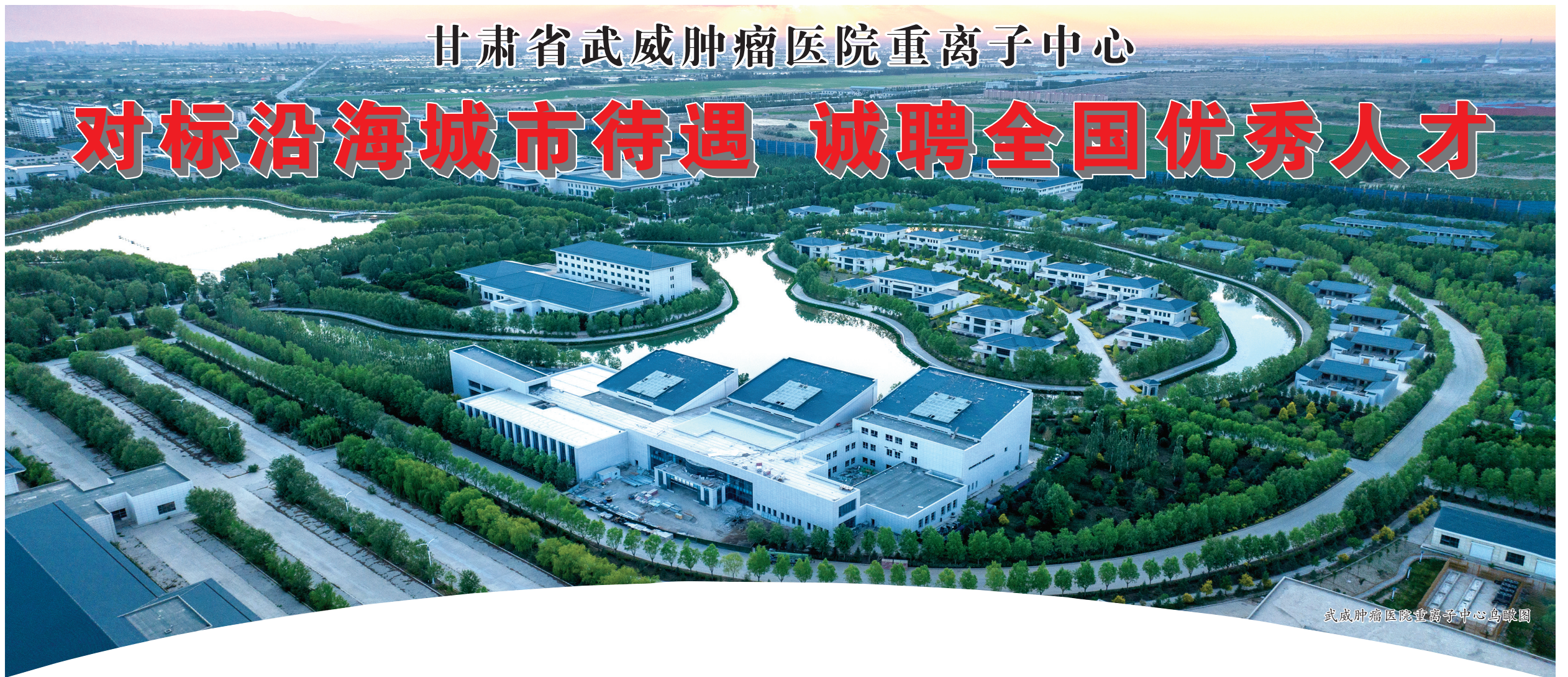
武威肿瘤医院重离子中心鸟瞰图