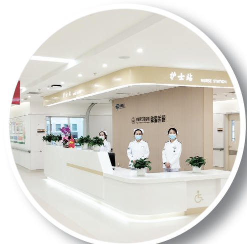
武威肿瘤医院重离子病区