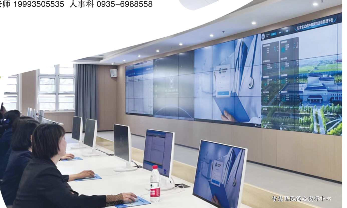
智慧医院综合指挥中心