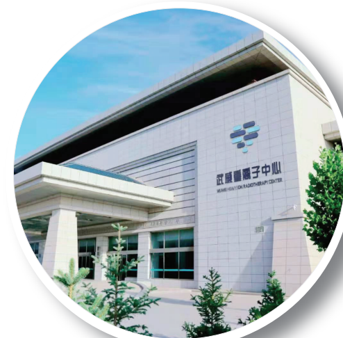
武威肿瘤医院重离子中心主楼

联系方式:王老师 18419558566 毛老师 19993505535 人事科 0935-6988558 邮 箱: 673467750@qq.com