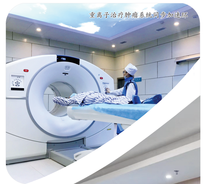
重离子治疗肿瘤系统同步加速环