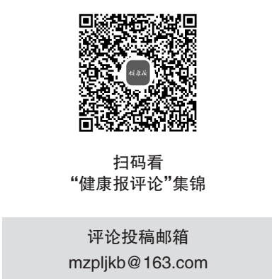
扫码看“健康报评论”集锦