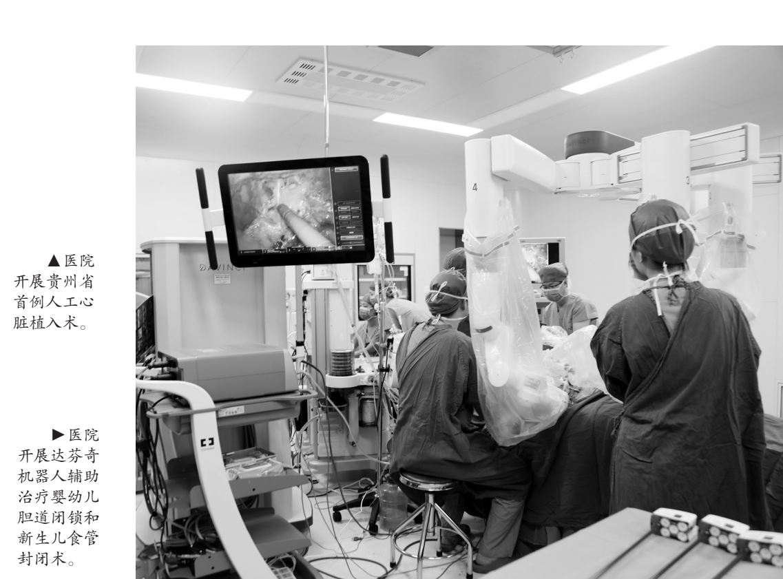
▲ 医院开展贵州省首例人工心脏植入术。