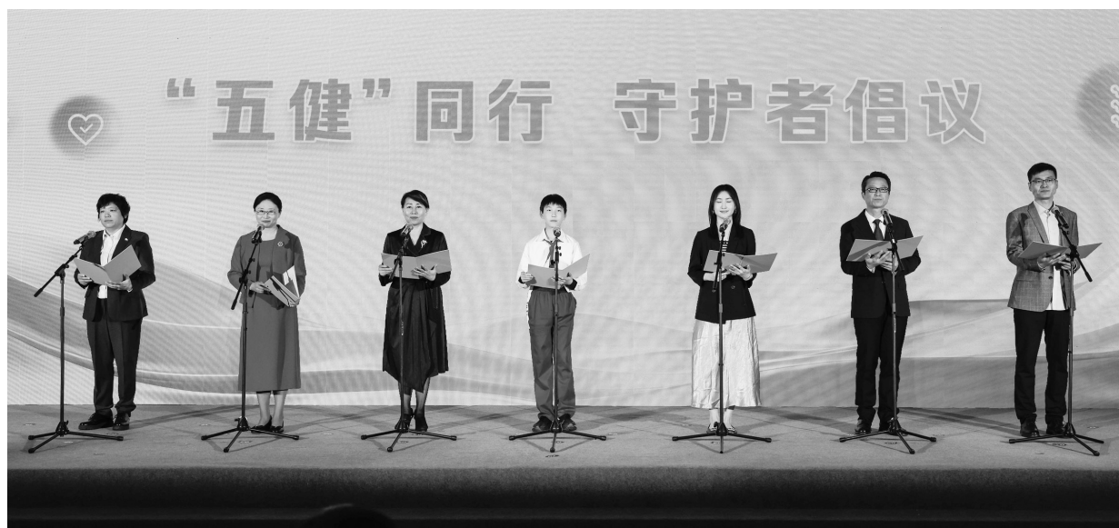
活动现场发布《“五健”同行 守护者倡议》,号召全社会齐心协力,做儿童青少年健康的守护者。

了”“眼镜越戴度数越深”“乳牙蛀了不用管,反正要换新牙”……针对这些在家长群中流传甚广的说法,5位权威专家在现场逐一给出专业判断。