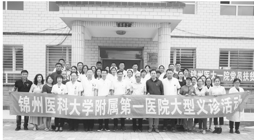
医院开展义诊活动