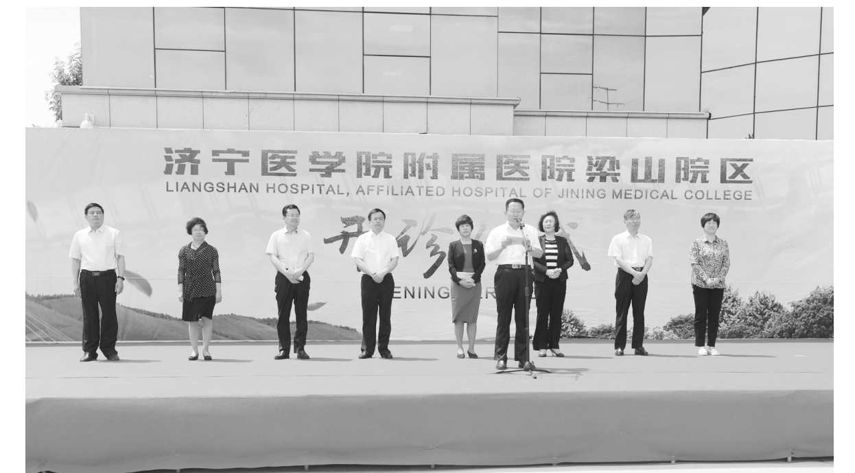
济宁医学院附属医院梁山院区举行开诊仪式