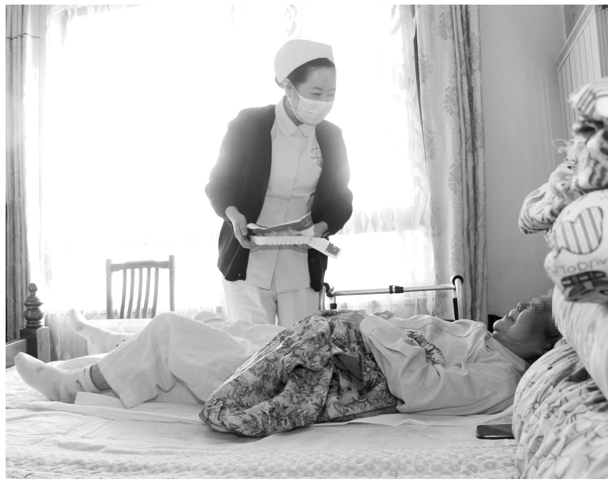
“云服务”平台上线居家医疗服务

值得注意的是，作为国内首家互联网医院的创办者，微医在数字医改领域已有多年探索实践。一方面，微医依托数字技术实现了供给侧、需求侧以及支付方之间的数字链接，数字“基础设施”不断完善。另一方面，微医在河南郑县、山东济南和泰安等多地通过系统、连续的创新实践，形成构建居民数字健康画像，为大医院分担压力，为基层医院提升能力，为医保提高效率，在以数字化推动分级诊疗方面积累了较为丰富的经验。