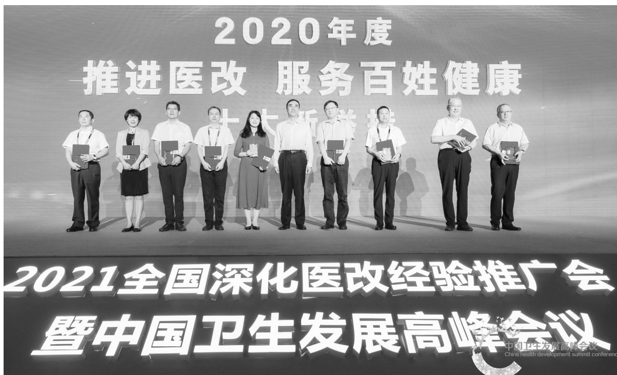
天津基层数字健共体入选“推进医改服务百姓健康十大新举措”

在“生产力”提升的同时，数字健共体更是带来了“生产关系”的改变，即从“价差模式”走向“效差模式”。前者以治病为中心，按项目付费，提供非连续性服务，患者数据散落在各医疗机构，彼此割裂，医务人员的激励主要靠药品、耗材供应链价差中来；而后者则以健康为中心，按病种/人头付费，医务人员为患者完整的数字健康画像的引导下，提供线上线下结合的全生命周期服务，激励从患者健康水平提升、医疗费用节约的“效差”中来。在国家“以治病为中心”转向“以健康为中心”的战略指引下，天津的探索实践或许也将代表数字化医改的未来趋势。