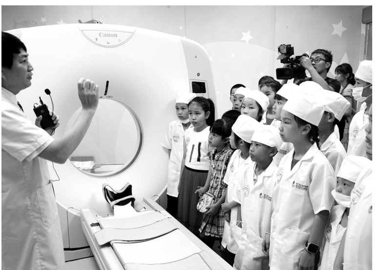
医院在儿童节开展公众开放日活动

安马山县妇幼保健院开展对口支援工作,通过“传帮带”提升基层单位医疗技术水平。医院举办3期妇幼保健医联体成员单位中层干部及业务骨干参加培训。通过远程会诊、现场指导、病例讨论等方式,医院为二级妇幼保健院提供孕产妇、新生儿危重救治技术培训。