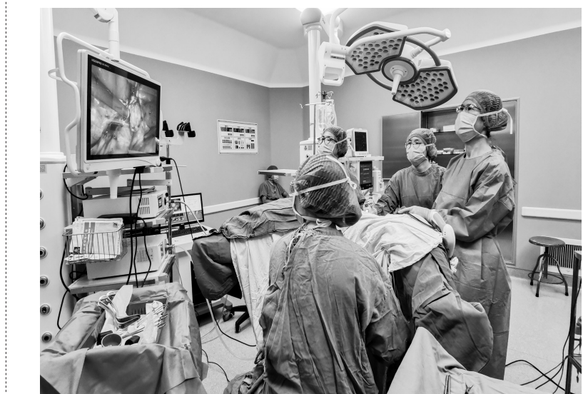
医院妇科行腹腔镜手术

加强妇幼卫生人员能力培训。医院派出15名医生到马山永福镇卫生院、兴宁区昆仑镇卫生院,以及上林、隆