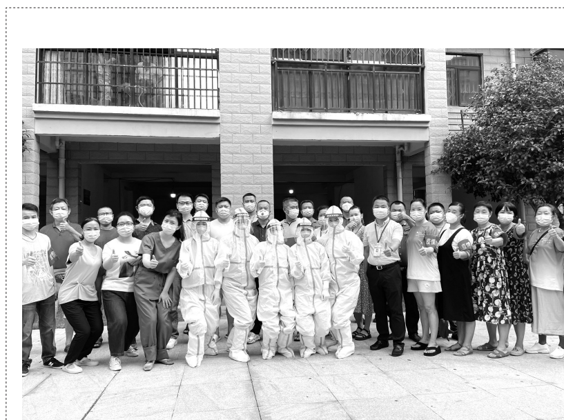
医院核酸采集小分队

医院牵头建立中医药发展联盟,长沙市芙蓉区范围内的社区服务中心均开设了“名中医门诊”,打造“社区中医名医工作室”,每周安排中医专家坐诊,将“简便廉验”的中医药服