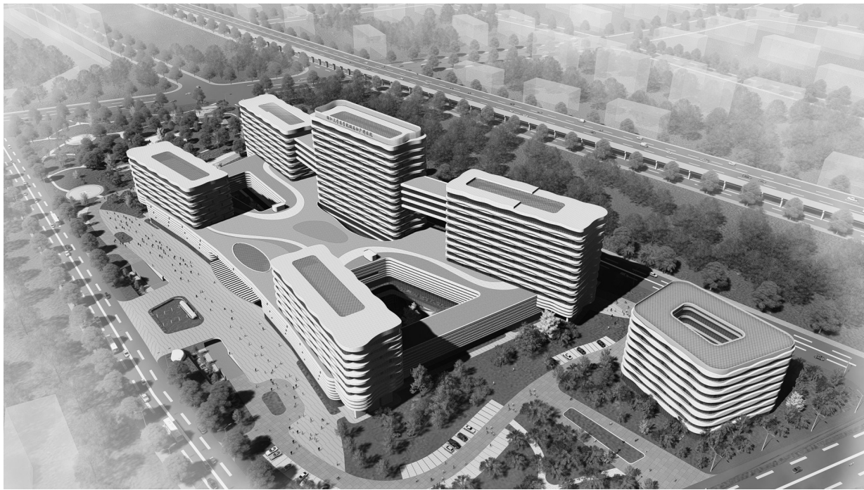
医院钱江院区效果图