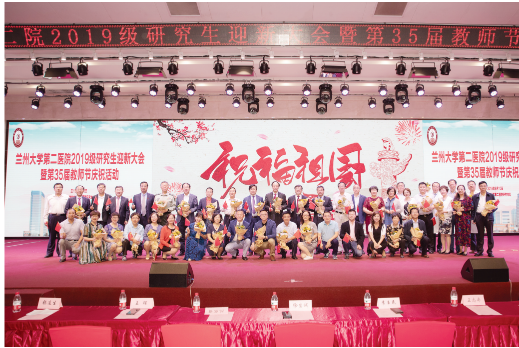
教师节庆祝活动会场

学院现有42个教研室,硕士及博士生导师142人(其中,博士生导师42人),教授54人,副教授112人。