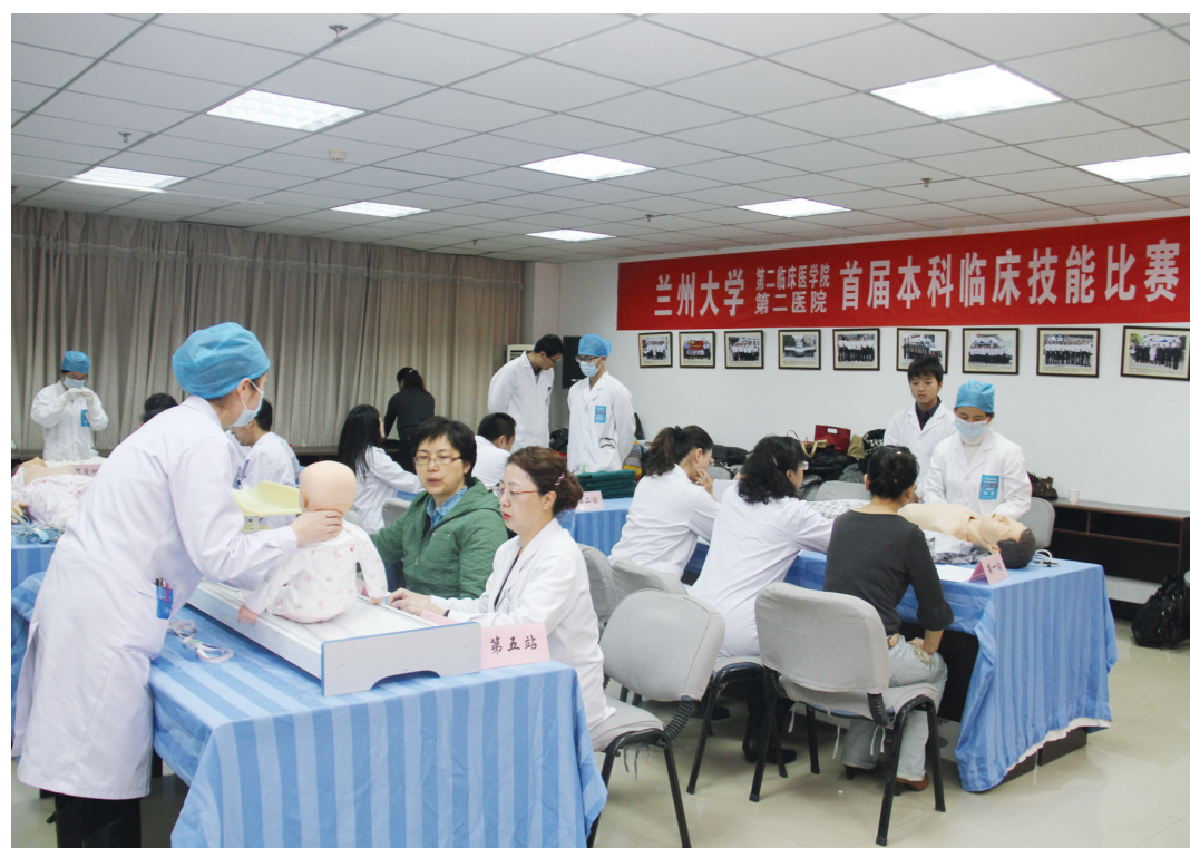
学院开展本科临床技能比赛