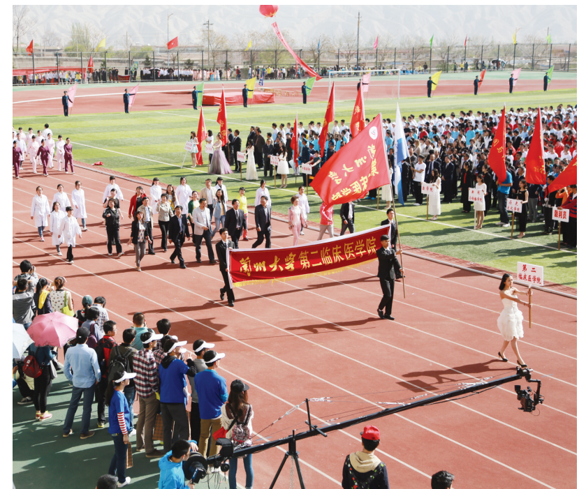
学院学生参加校运动会