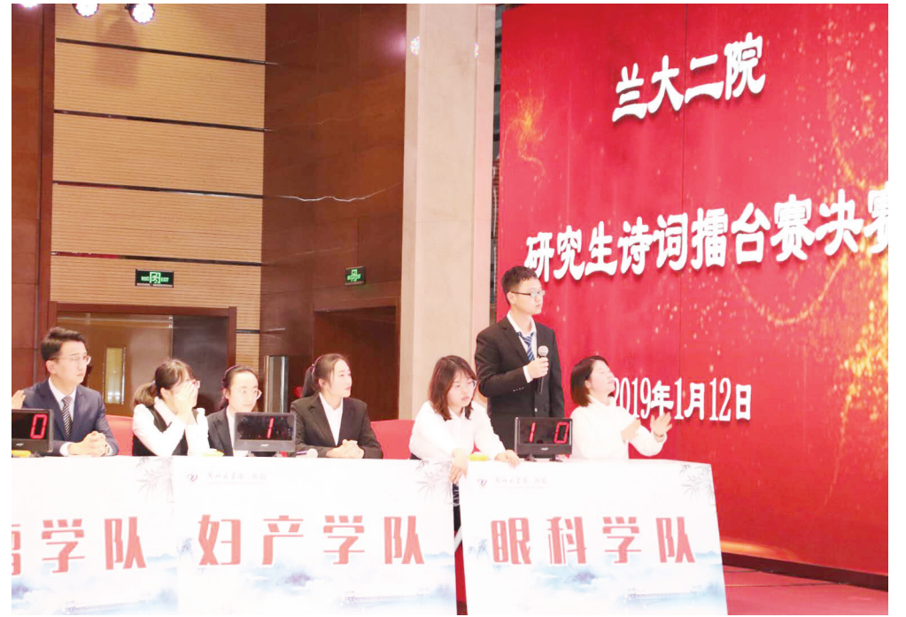
学术年会·诗词擂台赛现场