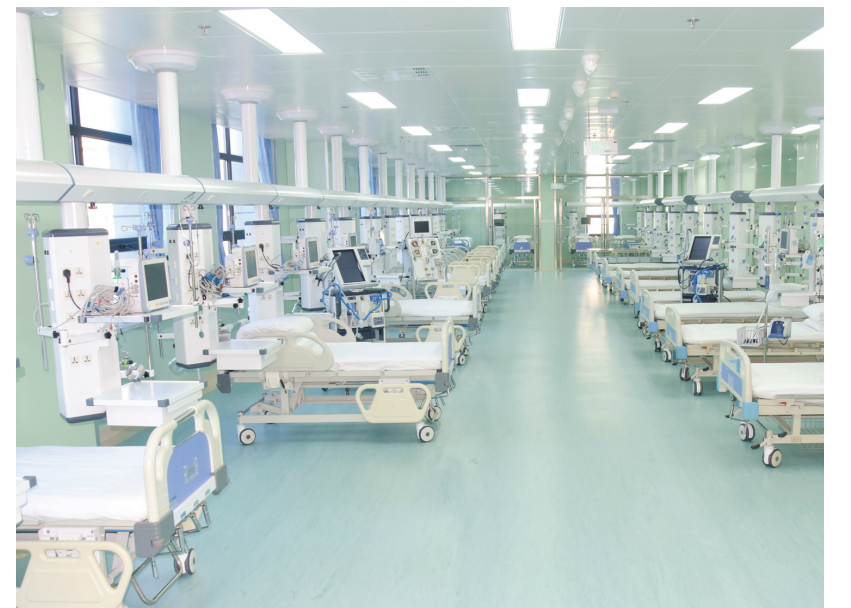
医院儿童重症监护病房(PICU)