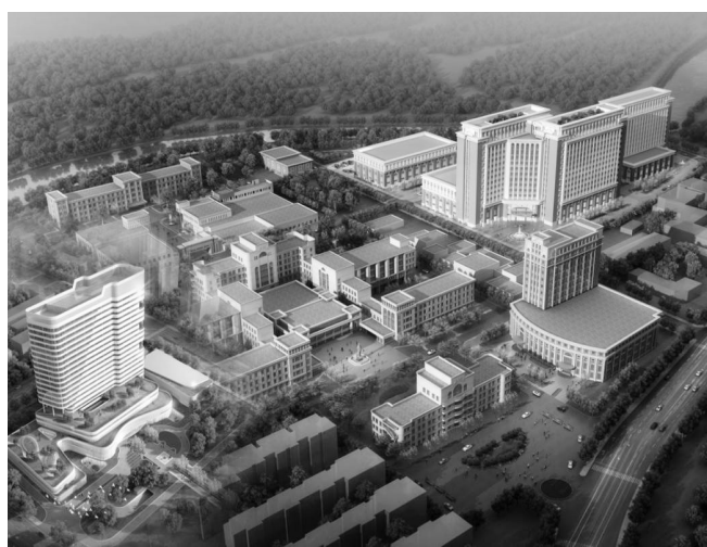
山东第一医科大学附属肿瘤医院鸟瞰图