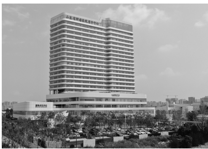
山东第一医科大学附属肿瘤医院质子中心