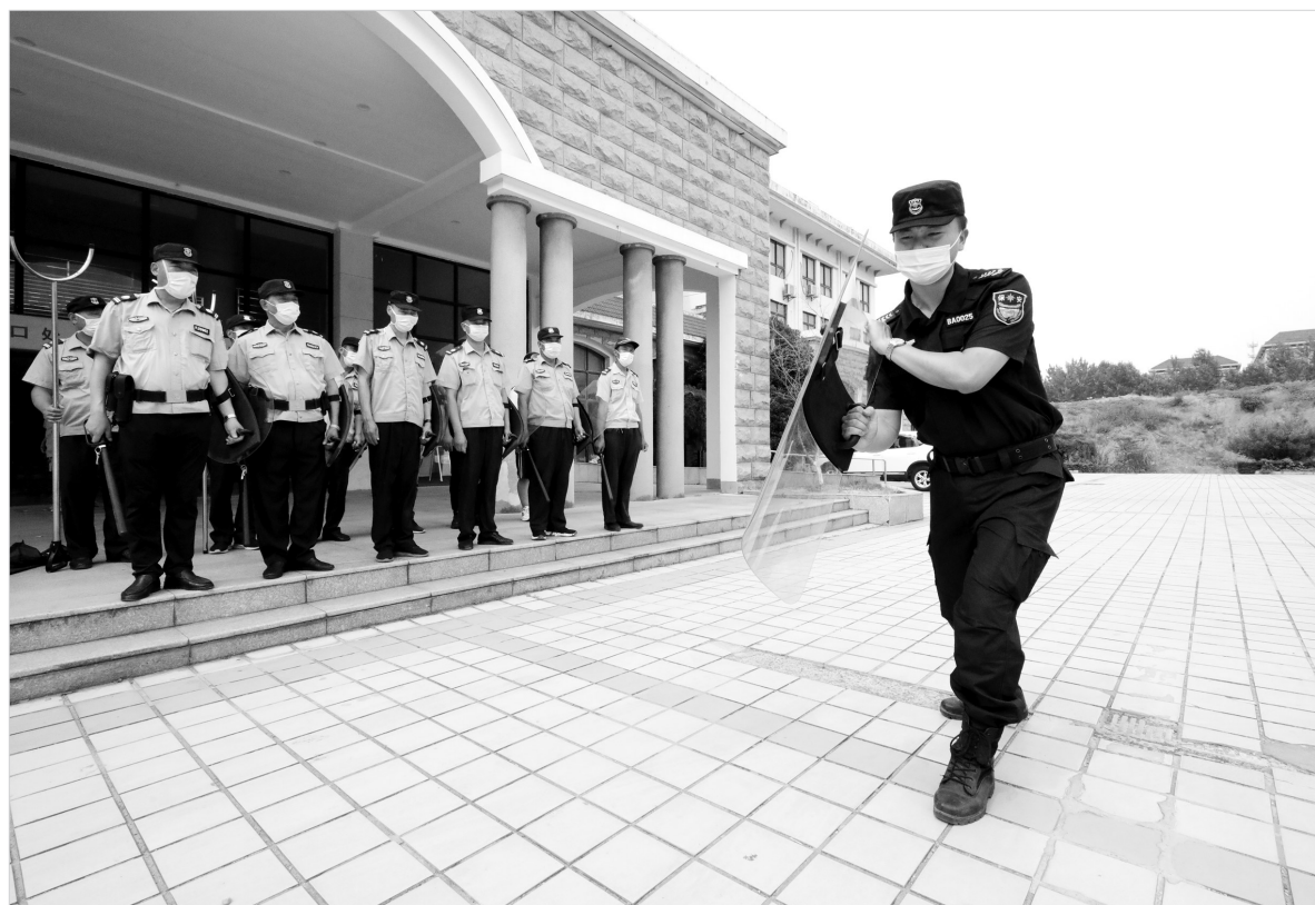
医警联动 防暴演练

据了解,自2019年以来,借助东西部协作医疗项目资金,仪陇县新建20个村卫生室,改扩建14个村卫生室,并为170个村卫生室添置了医疗设备。同时,持续投入1000余万元,在县人民医院、县中医医院建成了远程会诊、影像、心电、教学四大中心,基层医疗卫生机构全部接入。