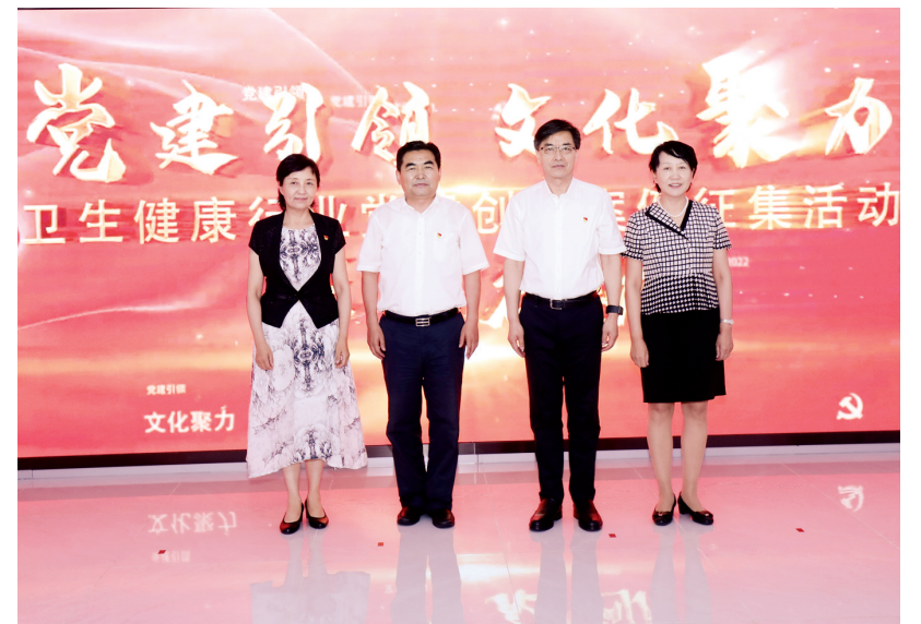
“党建引领 文化聚力——卫生健康行业党建工作宣传交流会暨卫生健康行业党建创新案例征集启动会”现场

控工作的经验,大力弘扬伟大抗疫精神和崇高职业精神,唱响主旋律,传播正能量。四是主流媒体要积极宣传引导。健康报社作为卫生健康行业的主流媒体,要以此次交流宣传活动为契机,为各地各级医疗卫生机构提供党建工作理论联系实际的窗口和平台。卫生健康行业党建工作宣传活动要突出卫生健康行业特点,精准把握公立医院党建工作重点,为各地各级公立医院提供展示形象的阵地,以高质量党建引领卫生健康事业高质量发展。