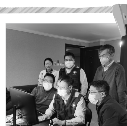
抗击新冠肺炎疫情国家流调专家队