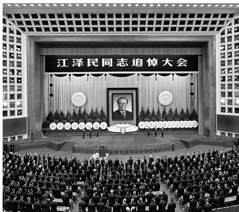
江泽民同志追悼大会会场。