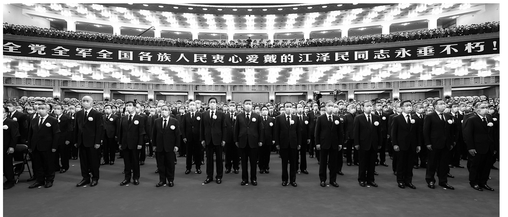
习近平、李克强、栗战书、汪洋、李强、赵乐际、王沪宁、韩正、蔡奇、丁薛祥、李希、王岐山等参加追悼大会。