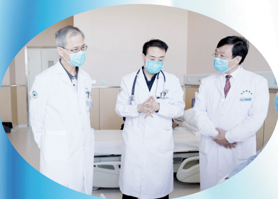
医院专家团队查房