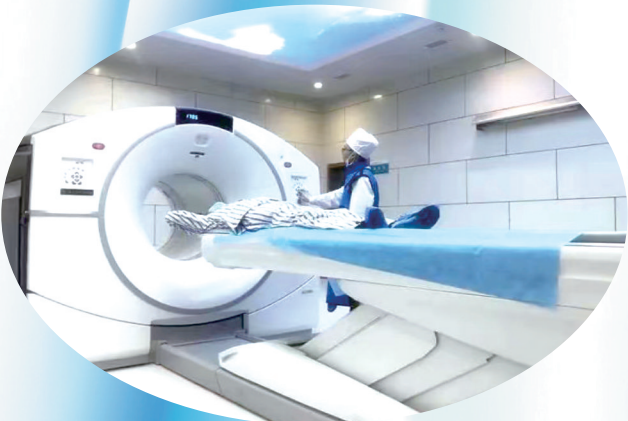
医院引进甘肃省地州市级医院首台PET-CT