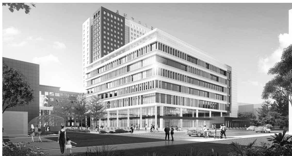
辽西肿瘤诊疗中心效果图