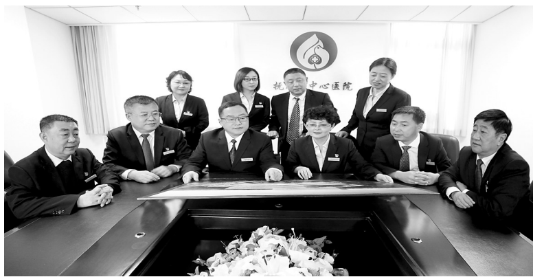
医院领导班子成员

在提升医疗质量方面,针对12个质控中心,医院从规范相关培训与质控检查工作入手,充分发挥各质控中心的指导与带动作用;在全院范围内