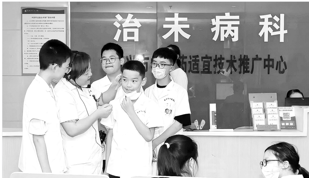
下图:7月7日,江苏省宜兴市中医医院开展“杏林小郎中”夏令营活动。孩子们通过体验耳穴埋籽等中医适宜技术操作、参观中药房、制作中药驱蚊香囊等活动,领略中医药文化的独特魅力。