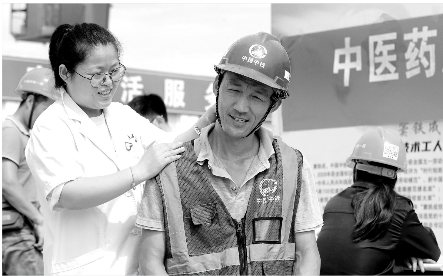
上图:近日,浙江省德清县康乾街道卫健办联合社区卫生服务中心,组织医务人员来到中铁一局杭德市域铁路项目工地,开展“中医药服务进工地”活动。医务人员为建设工人提供推拿、拔罐、贴三伏贴等中医健康服务,传授夏季养生及防暑知识。