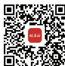
扫码看《通知》全文和“核心知识十条”

在强化关键环节和行为管理方面，《行动方案》提出，关注重点环节管理，加强中医、营养、康复、精神、检验、病理、影像、药学等科室的多学科会诊参与度，充分发挥营养和康复治疗对提升治疗效果的积极作用。在加强体系建设和检查督导方面，《行动方案》提出，各区卫生健康委要按年度开展优秀病案评比，北京市病案质控中心要组织开展本市医疗机构优秀病案评比工作，评选百佳病案并加强宣传交流。