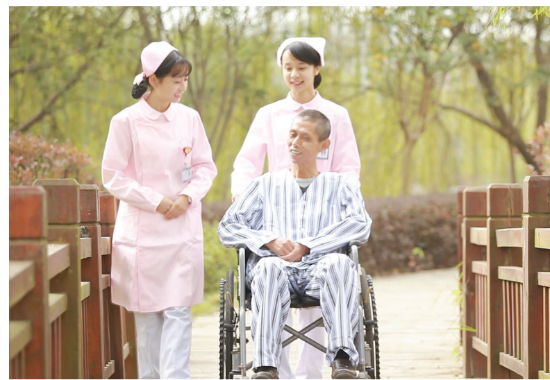
医院开展优质护理服务