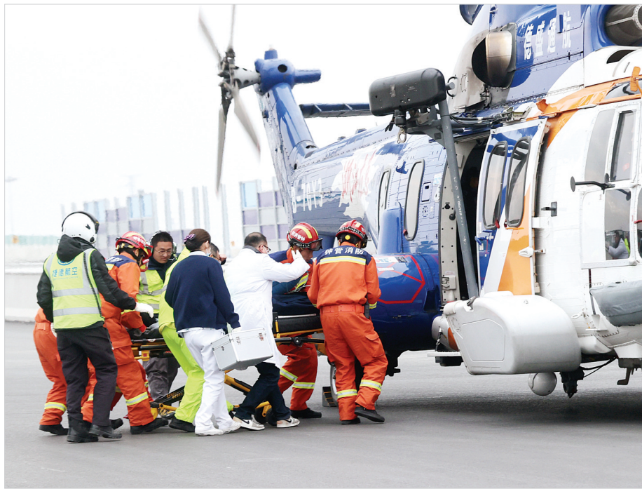
近日,浙江省湖州市德清县高速公路春运应急救援演练在湖杭高速士林枢纽举行。