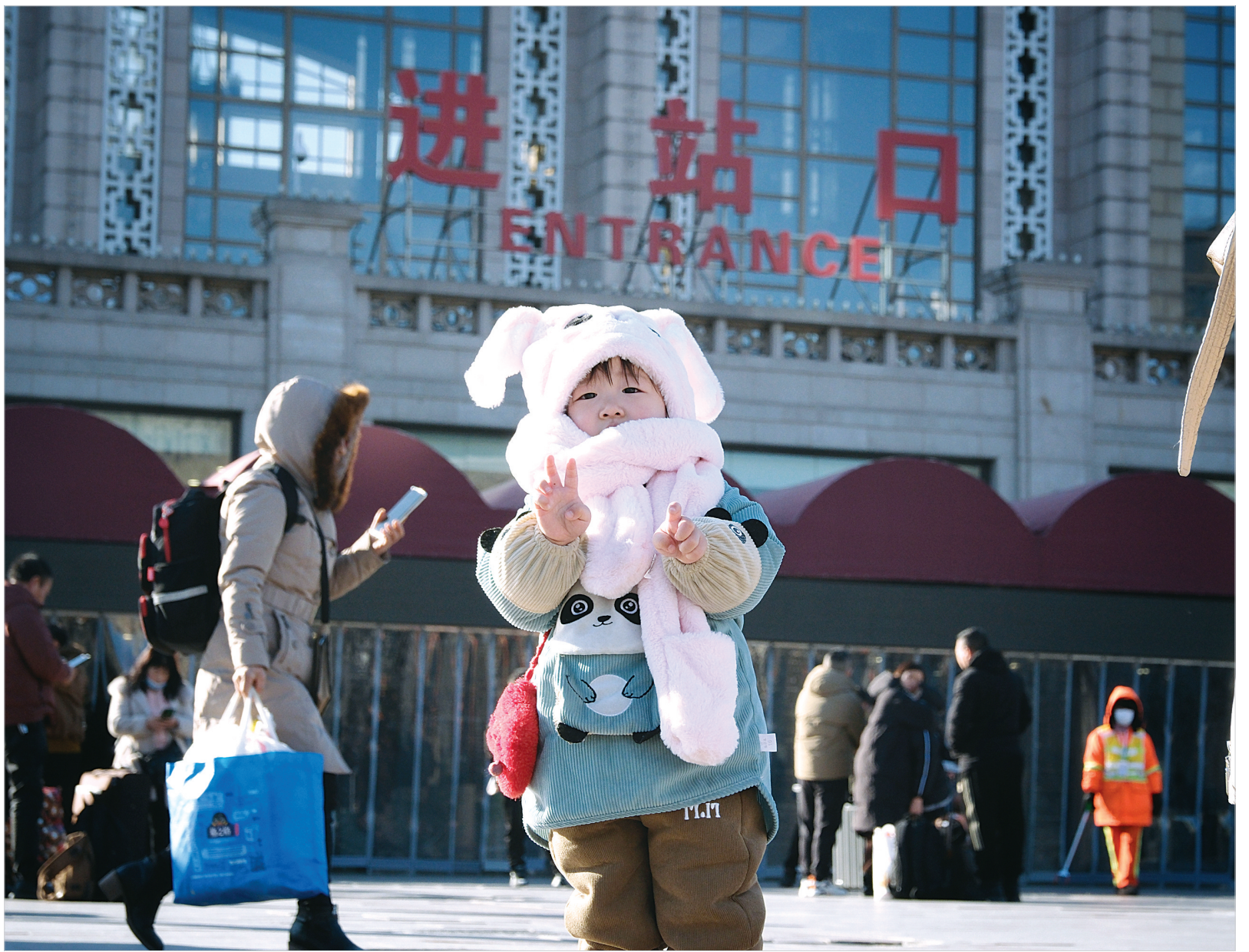
上图:1月26日,北京站进站口旁,旅客逐渐增多。一名儿童在拍照。