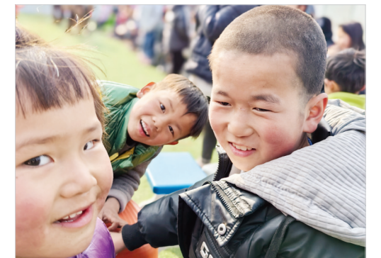
2月1日,积石山县大河家镇康吊村安置点的儿童之家聚集了各个年龄段的孩子一起玩耍。