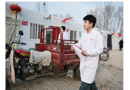
2月1日,积石山县大河家镇陈家村安置点内,巡回诊疗队的医生们正忙碌着,满足受灾群众就医需求。