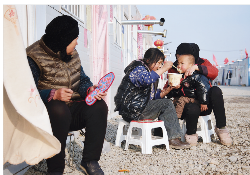
2月1日,积石山县大河家镇陈家村安置点,姐姐照顾年幼的弟弟吃方便饭。