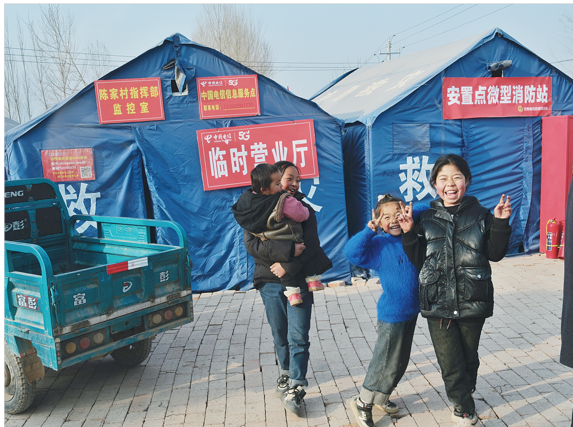
2月1日,积石山县大河家镇陈家村安置点内,孩子们脸上纯真的笑容传递着爱与希望。