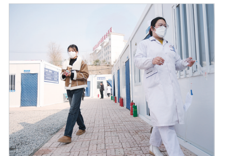
2月1日,积石山县中西医结合医院(大河家中心卫生院)搭建的临时板房前,护士正赶着去为患者输液。