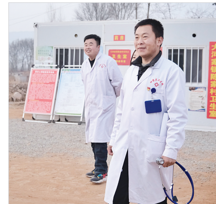
2月1日,积石山县大河家镇陈家村村卫生室的临时安置点前,医生正准备入户巡诊。