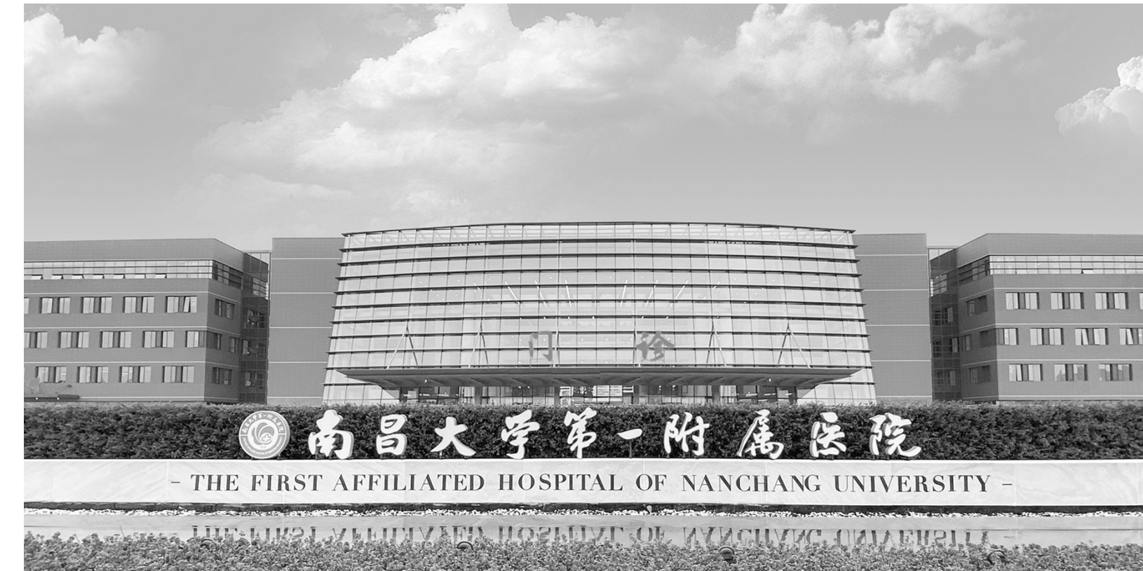
南昌大学第一附属医院象湖院区外景

为加快适应新时代的新要求、满足群众的新期盼，构建有江西特色的卫生健康服务体系，2023年1月《江西省卫生健康服务能力全面提升三年