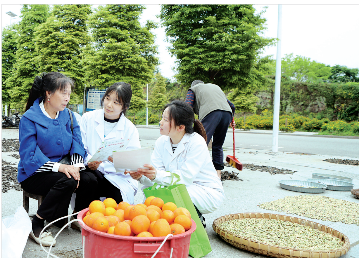
普及预防接种知识

《实施方案》要求,持续推进健康教育进乡村、进家庭、进学校,缩小农村、城市和地域之间的健康素养差距。省级组织开展卫生健康下乡暨行业先进典型“送健康到基层”示范活动;以县区为单位普遍开展“健康知识进万家”活动,发挥健康科普专家库和资源库作用,持续加强农村健康教育阵地建设和基层健康教育骨干培养,培养居民身边的家庭健康指导员和明白人。