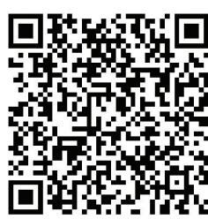
扫码查看详细监测结果

养水平由高到低依次为:安全与急救素养(59.33%),科学健康观素养(54.71%),健康信息素养(41.05%),慢性病防治素养(30.43%),基本医疗素养(28.84%),传染病防治素养(28.02%)。