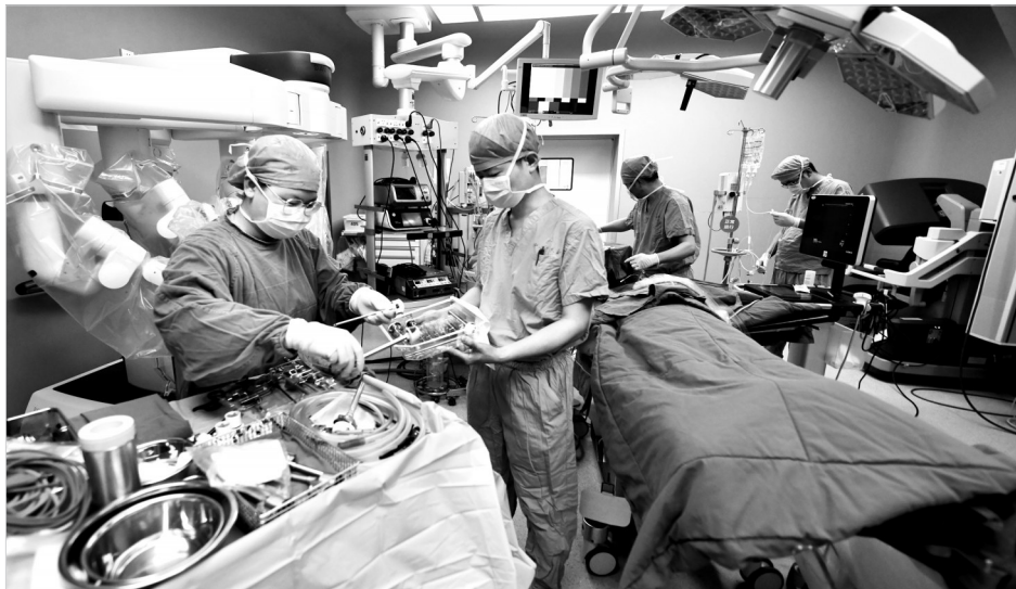
中日友好医院手术室内,护士在做术前准备。

随着外科手术技术的更新发展,高精仪器设备的广泛应用,护理团队也面临着新挑战。在夯实基础护理操作的基础上,团队着重开展手术护理、麻醉护理专科培训,组织护士参加市级及全国专项培训,不断提高业务水平和服务质量。