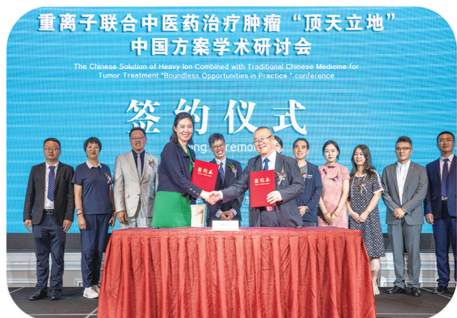
重离子联合中医药治疗肿瘤“顶天立地” 中国方案学术研讨会 签约仪式