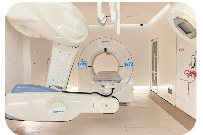
中国重离子治疗肿瘤系统治疗舱