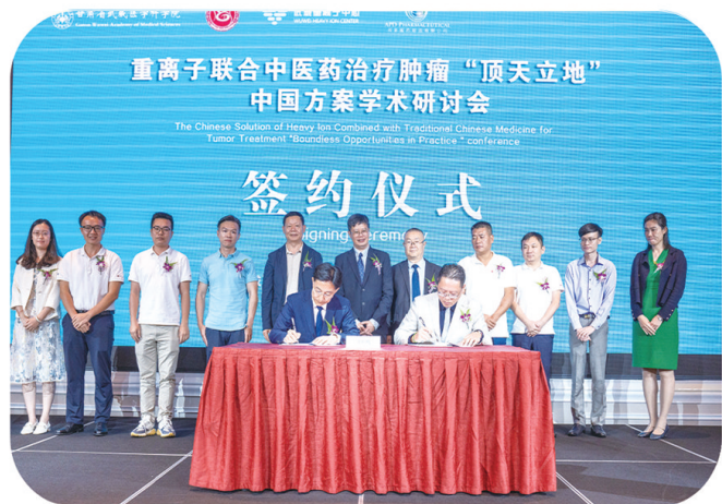
重离子联合中医药治疗肿瘤“顶天立地” 中国方案学术研讨会 签约仪式