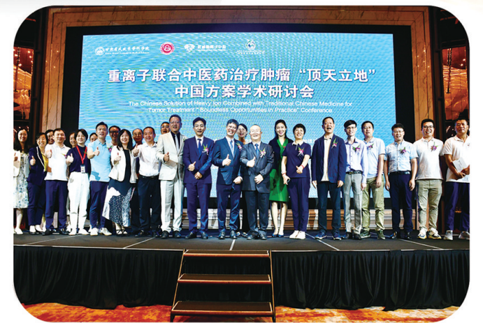
与会国内外学者、专家及社会各界人士合影留念