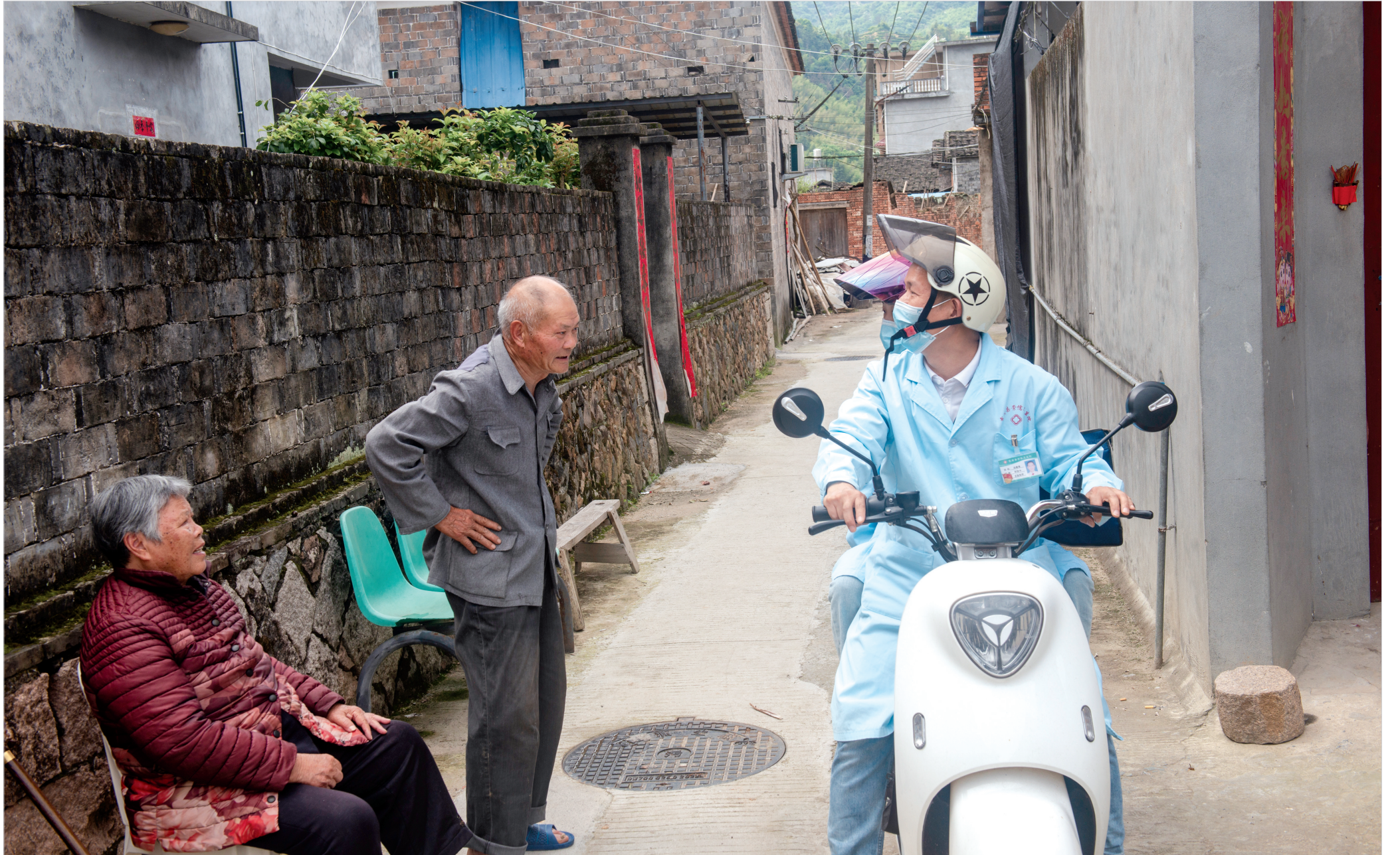
5月11日,崇儒卫生院医护人员入村开展家庭病床服务时,与在小巷里休闲的村民交谈。