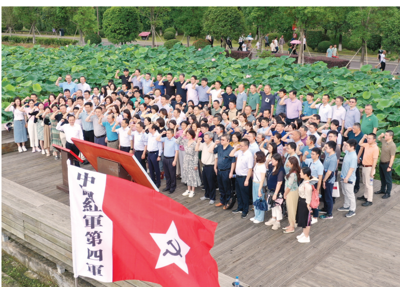
武汉协和医院赴福建古田开展基层党组织书记培训