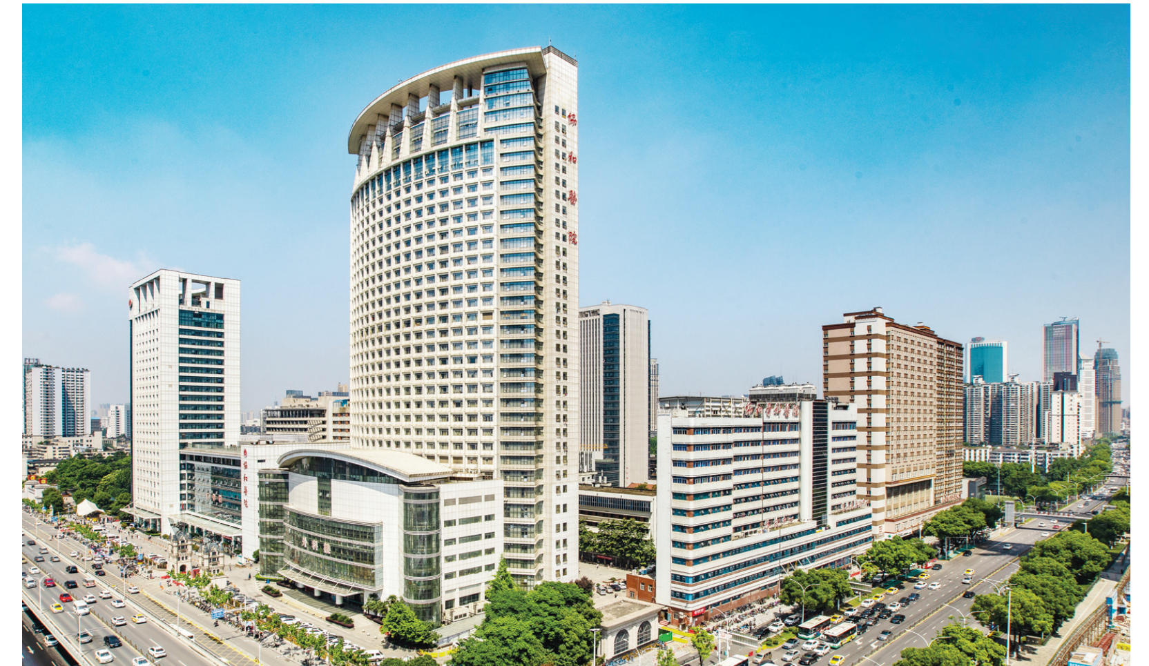
武汉协和医院主院区全景图

截至目前,武汉协和医院已累计完成器官移植手术逾3800例,其中心脏移植手术数量连续5年居全国第一。在院完成的1000余例心脏移植手术中,儿童心脏移植手术已超百例。心外科董念国教授团队多年来潜心在心脏移植领域探索,跑出了“极微创心脏移植”新模式。血液科胡豫教授团队20年磨一剑,建立了静脉血栓标本库,并发现了中国人特有的“易栓症”基因,为破解疾病谱写下了中国人