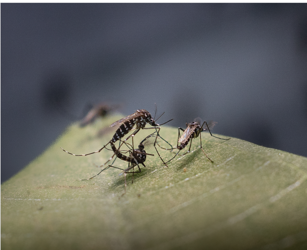
7月9日,中山大学广州校区北校园,一只经过辐照绝育的雄性白纹伊蚊(左下)正在和野生雌性白纹伊蚊(左上)交配。