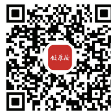
扫码看全部服务内容

康行政部门、中医药主管部门要结合实际情况制定行动具体实施方案并组织推动落实落细。医疗卫生机构应至少安排两名工作人员一同上门服务，并为工作人员提供必要的安全保障，根据需要购买人身意外伤害保险等；提供上门服务时，应有具备完全民事行为能力或亲属等在场，依法保障失能老年人合法权益。