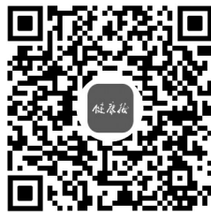
扫码看《指导意见》全文

力建设,健全疫情监测体系和信息报告制度,及时准确作出预警。而建立健全智慧化多点触发传染病监测预警体系,让疫情在早期就触发预警,从而对其加以科学研判,及时采取相应防控措施,方能更好地应对未来新发突发传染病、群体性不明原因疾病、重点传染病。