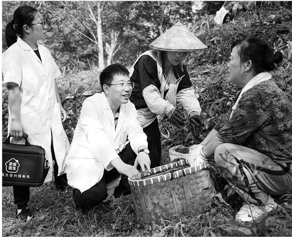
“山海”专家 巡诊到山间

“红色”的诊所列为随机监督检查、跨部门联合检查、专项检查的重点对象，约谈机构负责人，在行政处罚后一个月内跟踪督导整改。整改成效明显的升为“蓝色”等级。发现严重违法行为的，责令停止执业活动，撤销其备案并及时向社会公告。将评定为“黄色”等级的诊所，列为专项检查重点关注对象，督促其对照存在的问题立即进行整改，完成整改的转为“蓝色”等级，未完成整改或者整改不力的，依法进行行政处罚，并转为“红色”等级。将标注“蓝色”的诊所列为常规指导对象；对发现问题的，重新确定颜色等级。