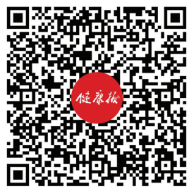
扫码看服贸会探访系列文字及视频报道