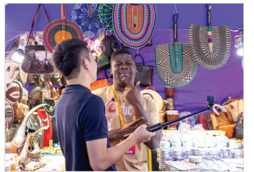
此次服贸会,吸引了众多外国参展企业参会。