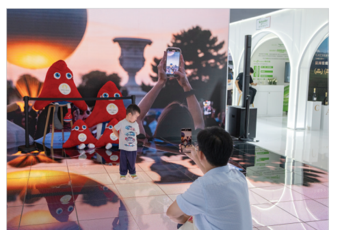
9月15日,服贸会国别展区,一名父亲带着孩子在法国馆与巴黎奥运会吉祥物玩偶合影留念。