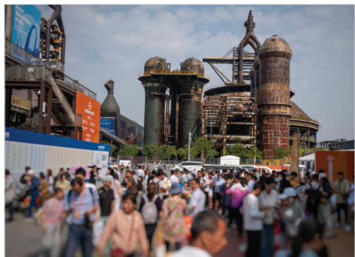
9月15日,观众在服贸会首钢园区内参观。