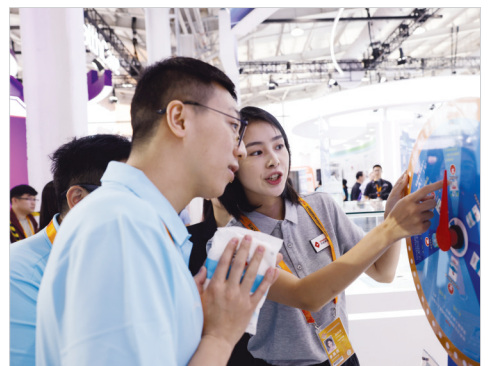
在北京市疾控中心展区,工作人员通过转盘游戏与群众互动,普及“三减三健”知识。