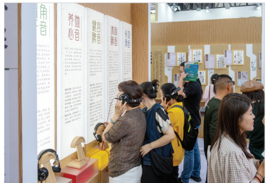
9月16日,服贸会首钢园6号馆,观众在中医药健康文化体验馆。