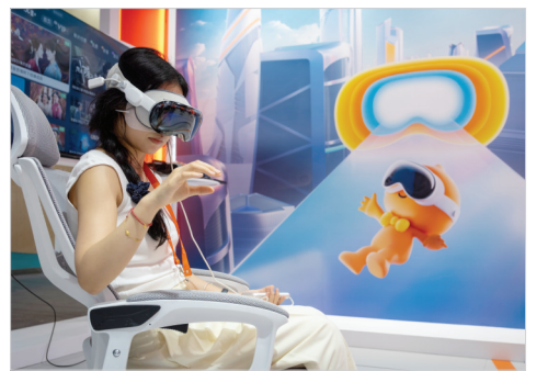
9月12日,参观者在阿里巴巴公司展台体验VR设备。