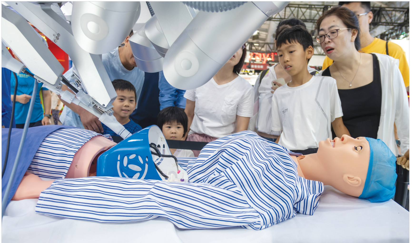
9月16日,参观者在观看手术单孔腹腔镜手术机器人表演。据了解,该机器人具有单孔超微创、操作灵活有力、视野调整范围大、定位臂安全协动等特点。

整个服贸会期间,互动性、参与感最强的,非体育服务专题莫属。在该专题宽阔的户外展区,各种运动项目让人大开眼界。我国刚刚在巴黎奥运会包揽金牌的乒乓球项目,是国人眼中的“王者”项目。“2024年服贸会乒乓球精英赛”在此举行,颇为精彩。即将进入下一届奥运会的壁球项目,也早在此建好体验区,欢迎参观者“尝鲜”。在新兴潮流体育服务展区,不乏跳街舞的孩子、跑酷的少年、踢球的队伍,多场精品赛事和一系列群众体验活动同时展开。走进室内展馆,体育健身数字化、智能化的趋势清晰可见。北京数字经济公开赛服贸会专题赛现场,设有数智骑行、数智划船、电子舞蹈、人机乒乓球、虚拟赛车的体验区,不少健身爱好者排队等候一展身手。在各个展位,有更多体育产业与数字技术深度融合的服务和产品。AI八段锦系统的大屏幕上,虚拟人带领体验者练习健身八段锦;数字体育升级和运营一站式平台,为运动健身场馆、公园、健身房等提供全场景数字化解决方案……当体育插上“数字翅膀”,就成为推动体育产业升级、提升健身环境、促进人民健康的新生动力。随着大健康理念逐渐深入人心,医体融合作为一种创新健康服务模式,正为实现全民健康目标贡献力量。