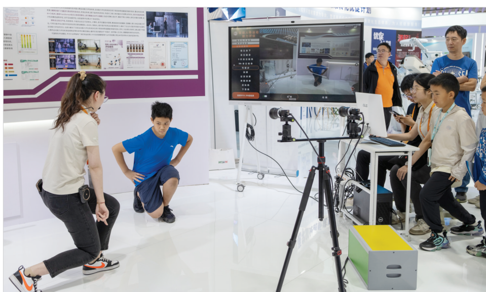
9月16日,中国科学院阜外医院展区,工作人员在为一名少年进行智能人体运动能力评估。