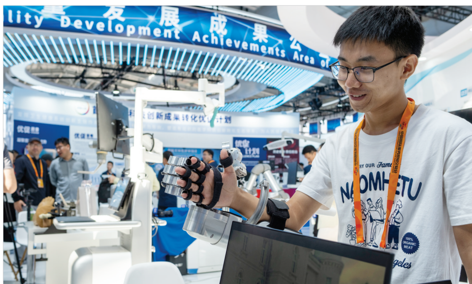
9月12日,北京积水潭医院展区,一名参观者在体验上肢康复外骨骼机器人。该设备可实现上肢尤其是手部精细功能的康复。