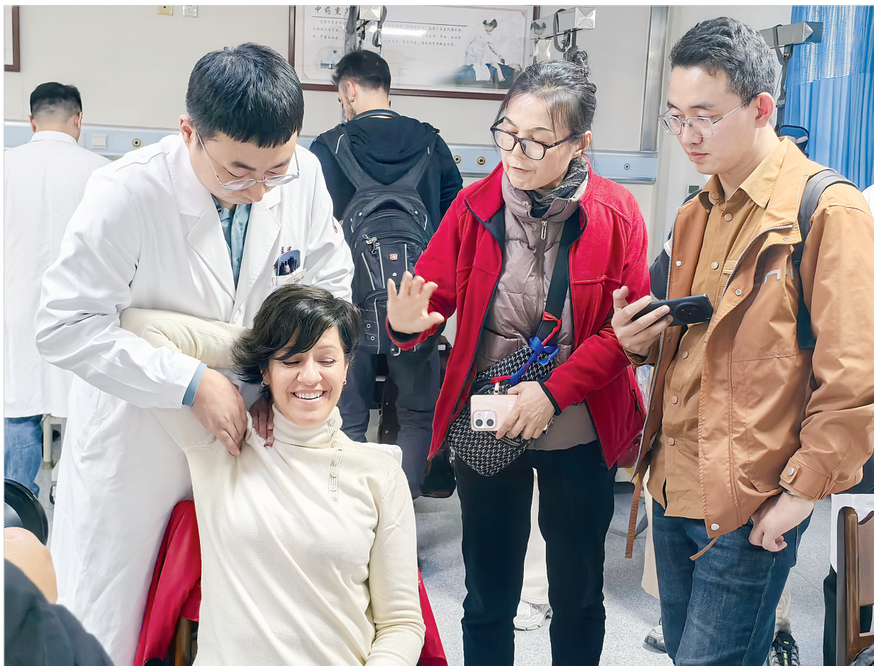
外媒记者团 体验中医药文化

在粤港两地多个部门通力配合、协力推动下，救护车跨境直通的各环节打通。此次演练是基于实情的最后推演，演练结束后，粤港两地举行跨部门工作会议，进一步理顺救护车直通运送的实际操作及流程。11月开始试行后，粤港两地将视成效及运行经验，商讨扩大救护车跨境直通指定医院范围。