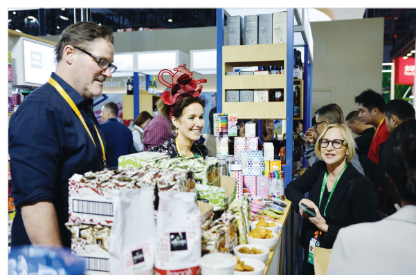
11月6日,进博会食品及农产品展区内,参展商和参观者在交流。