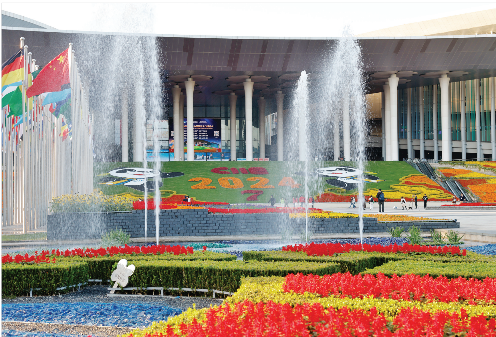
国家会展中心(上海)南广场彩旗飘扬、花团锦簇、绿意盎然,给在此举办的第七届中国国际进口博览会增添了喜庆热烈的气氛。