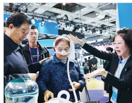
11月6日,进博会医疗器械及医药保健展区内,参观者在体验飞利浦梦精灵鼻罩。