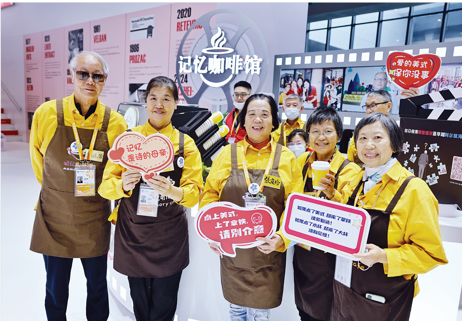
11月6日,进博会医疗器械及医药保健展区内,“记忆咖啡馆”的志愿者在合影留念。

在碧迪医疗设立的“银发健康及居家护理”沉浸式场景化专区中,一位社区卫生服务中心人员正在体验一款末梢采血器。他表示,服务的老年人越来越多,血糖检测等都需要末梢采血,采血时让老年人比较舒适、保证采血的准确性、降低感染风险是他们的需求。