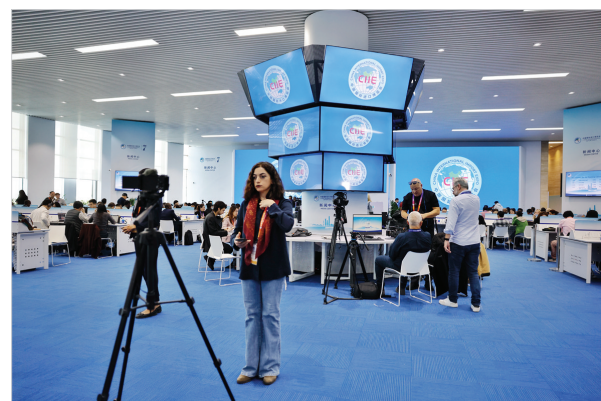
11月5日上午,进博会新闻中心内,一位外国媒体记者在直播。