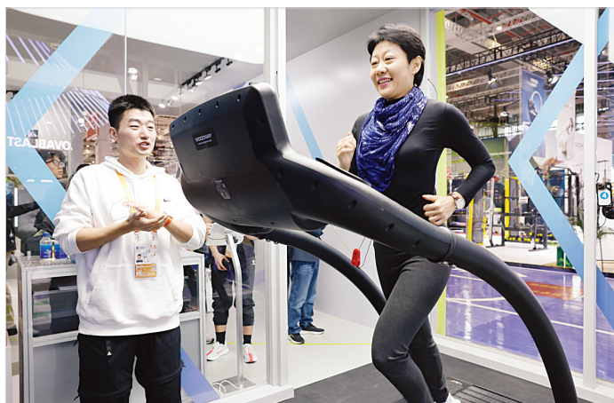
11月7日,进博会耐克展区,全新跑步咨询服务耐克运动研究实验室“Form”亮相,为参观者提供现场互动体验。