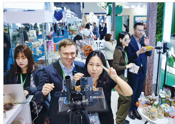
11月6日,进博会食品及农产品展区的白俄罗斯展厅内,参展商在直播卖货。