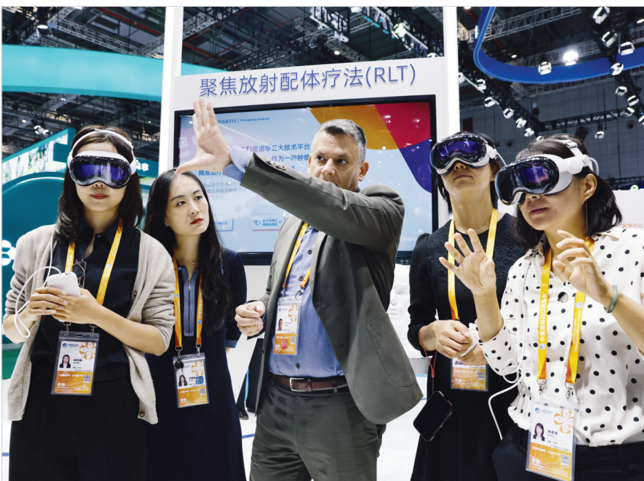
11月6日,进博会医疗器械及医药保健展区内,参观者在诺华展台利用AR(增强现实)技术体验放射配体疗法的治疗过程。