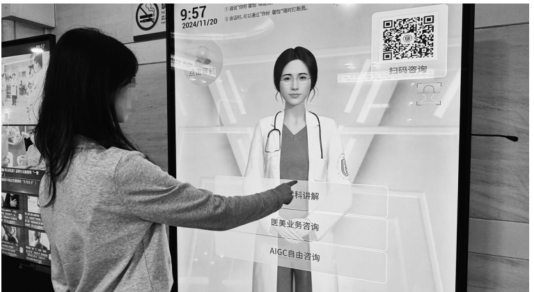
浙江省人民医院推出AI陪伴就诊服务,方便患者就医。