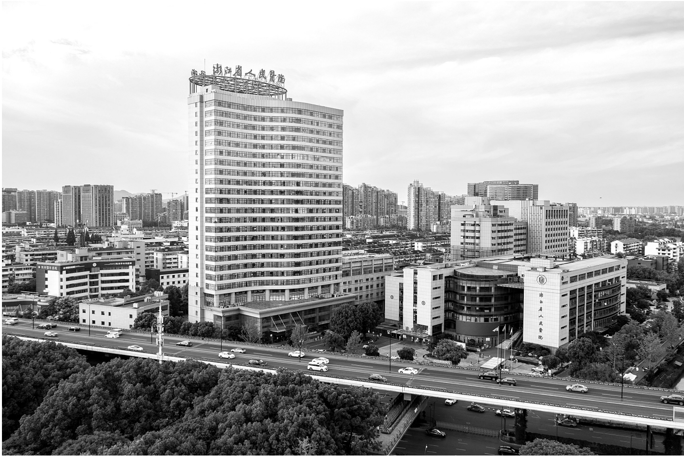
浙江省人民医院外景