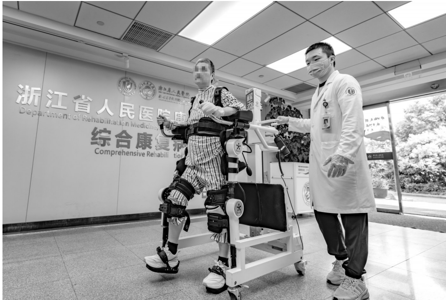
患者在浙江省人民医院治疗师指导下,利用外骨骼机器人辅助设备恢复步行能力。