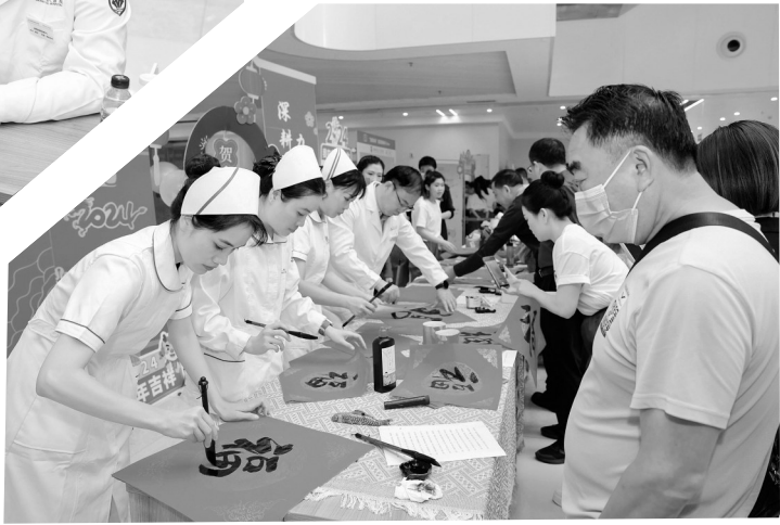
医院举办丰富多彩的文化活动。